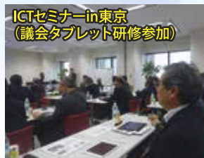
ICTセミナーin東京 (議会タブレット研修参加)