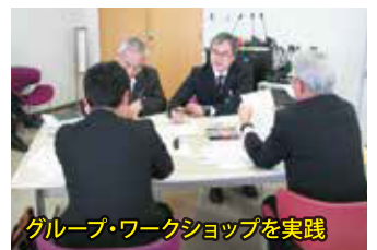
グループ・ワークショップを实践

・2回の研修では、「ファシリテーション(話し合いの場で発言を促したり、話しの内容を整理したり、会議を円滑に進める技術)」の手法を学ぶ。今回の研修で得た技術を活かし、市民と議会とのより良い意見交換会を目指します。