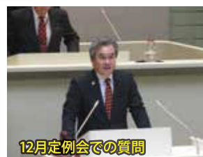
12月定例会での質問