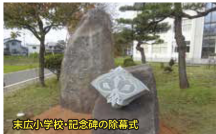
末広小学校・記念碑の除幕式