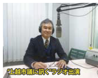
「上越市議に訊く」ラジオ出演