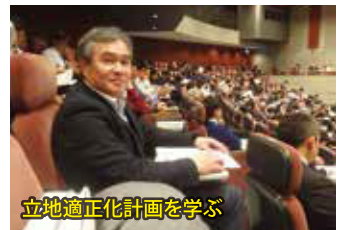
立地適正化計画を学ぶ

・2日間の講義では、国土交通省の考えや、多くの自治体の取り組みについて学ぶ。これらに関連し「公共施設再編」や「空き家対策」の取り組みなどについても学ぶ。上越市でも「立地適正化計画」を策定して動き出すので、今後も注目したい。