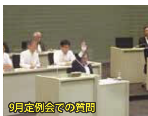
9月定例会での質問