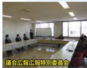
議会広報広聴特別委員会