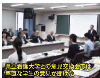
県立看護大学との意見交換会では 率直な学生の意見が聞けた