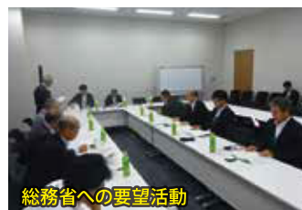
総務省への要望活動