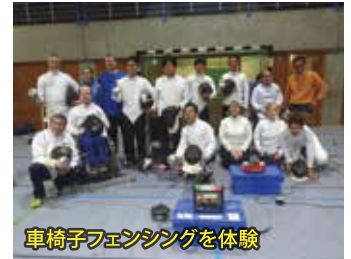
車椅子フェンシングを体験