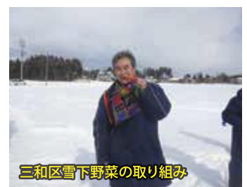
三和区雪下野菜の取り組み