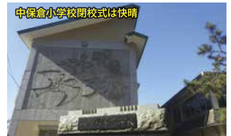
中保倉小学校閉校式は快晴

浦川原区の3つの小学校は、この平成29年3月31日をもって長い歴史に幕をおろします。そして3校は統合し、平成29年4月1日より新しく「浦川原小学校」としてスタートします。今後、新たなコミュニティの形成をめざし、浦川原区が一つになって地域の子供たちを育てて行きましょう。