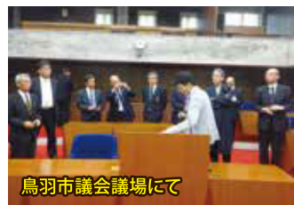
鳥羽市議会議場にて