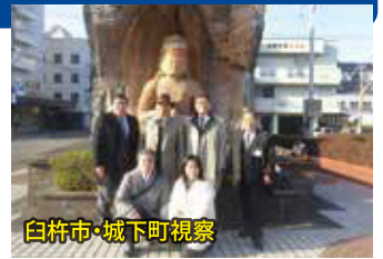
臼杵市・城下町視察

・臼杵市の古い街並みを残し、生活と調和したまちづくりは、市民から声が上がリ、街並みの調査と共に、官民連携して街づくりに取り組んでいる。