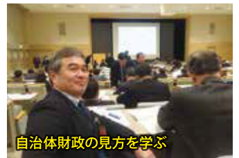
自治体財政の見方を学ぶ

・地方自治体の財政運営と、自治体財政指標の見方を学ぶ。そしてグループに分かれて財政指標分析の演習を行い、議員としての役割についても学ぶ。