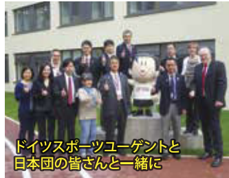
ドイツスポーツエージェントと 日本団の皆さんと一緒に