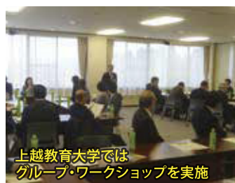
上越教育大学では グループ・ワークショップを実施