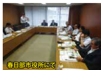
春日部市役所にて