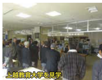
上越教育大学を見学