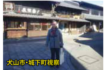
犬山市・城下町視察

・「犬山城下町を守る会」が街並み保全に取り組んできた活動を学ぶ。国宝「犬山城」をシンボルに栄えた城下町を整備し、市民が誇れる街づくりが進んでいる。