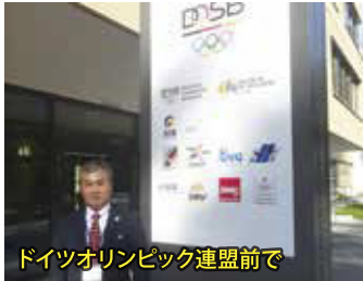
ドイツオリンピック連盟前で

・日本スポーツ少年団の指導者として、日本団7名に選抜されて、2週間の日程でスポーツ先進地ドイツ研修に参加してきました。世界を見てきたこと、多くの人と出会えたことは貴重な経験になりました。上越市は2020年東京オリンピック・パラリンピック開催に向けて、ドイツ体操チームの合宿招致が決まりました。これから上越市とドイツとの交流が進むことを願い、私もしっかり取り組んでいきます。