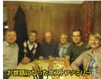
お世話になったホストファミリー