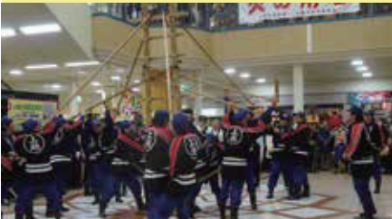
大潟方面隊“はしご登り”披露