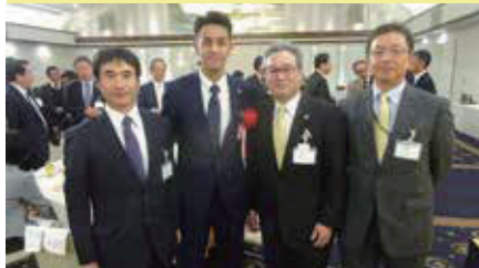
新たな岐路に立ち前へ進む