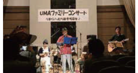
音楽で地域を元気に