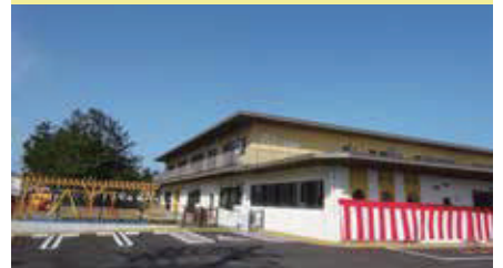
直江津地区2つの保育園統合