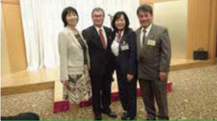
三市の交流で活性化