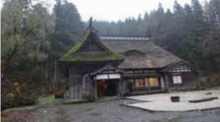
大島区菖蒲“飯田邸”にて