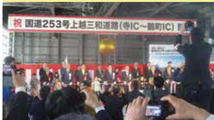
浦川原区までの開通を願う