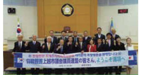
初の友好都市訪問