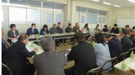
上越基幹相談支援センターと