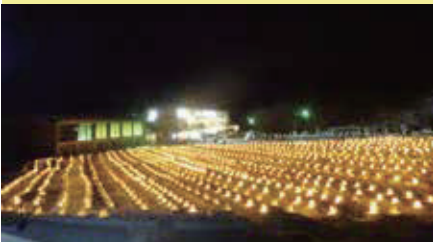
雪国を元気に!“月影の郷”